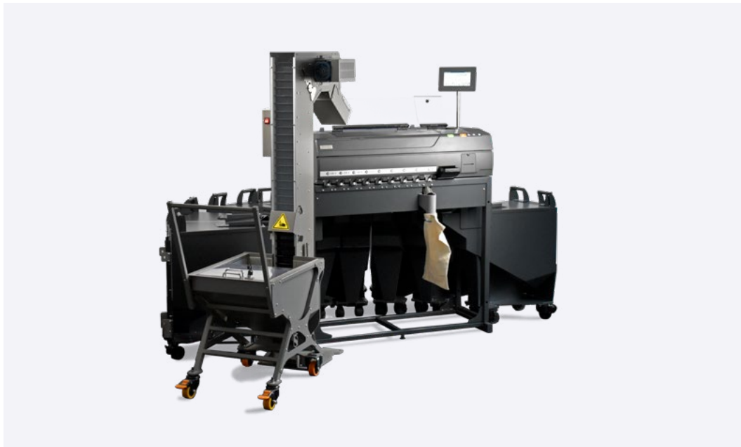
EvoSort H9 mit Dreieckscontainer sowie Münzlift mit XL-Container