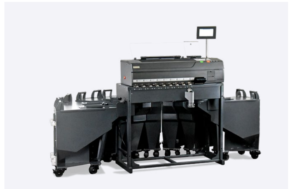
EvoSort H9 mit Dreieckscontainern